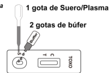
Muestra de Suero/Plasma